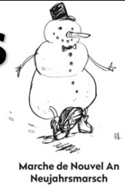
Marche de Nouvel An Neujahrsmarsch